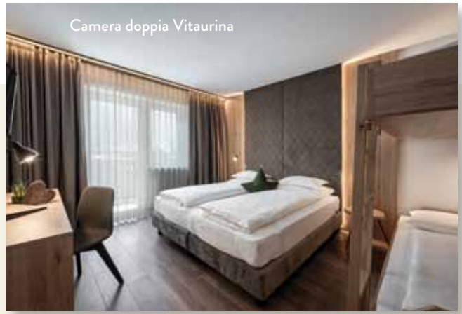
Camera doppia Vitaurina