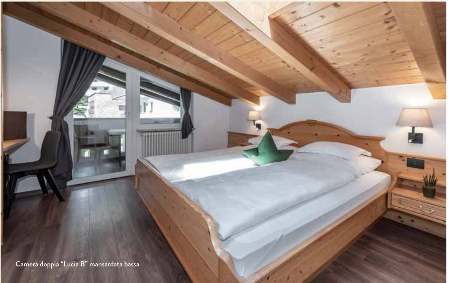
Camera doppia "Lucia B" mansardata bassa